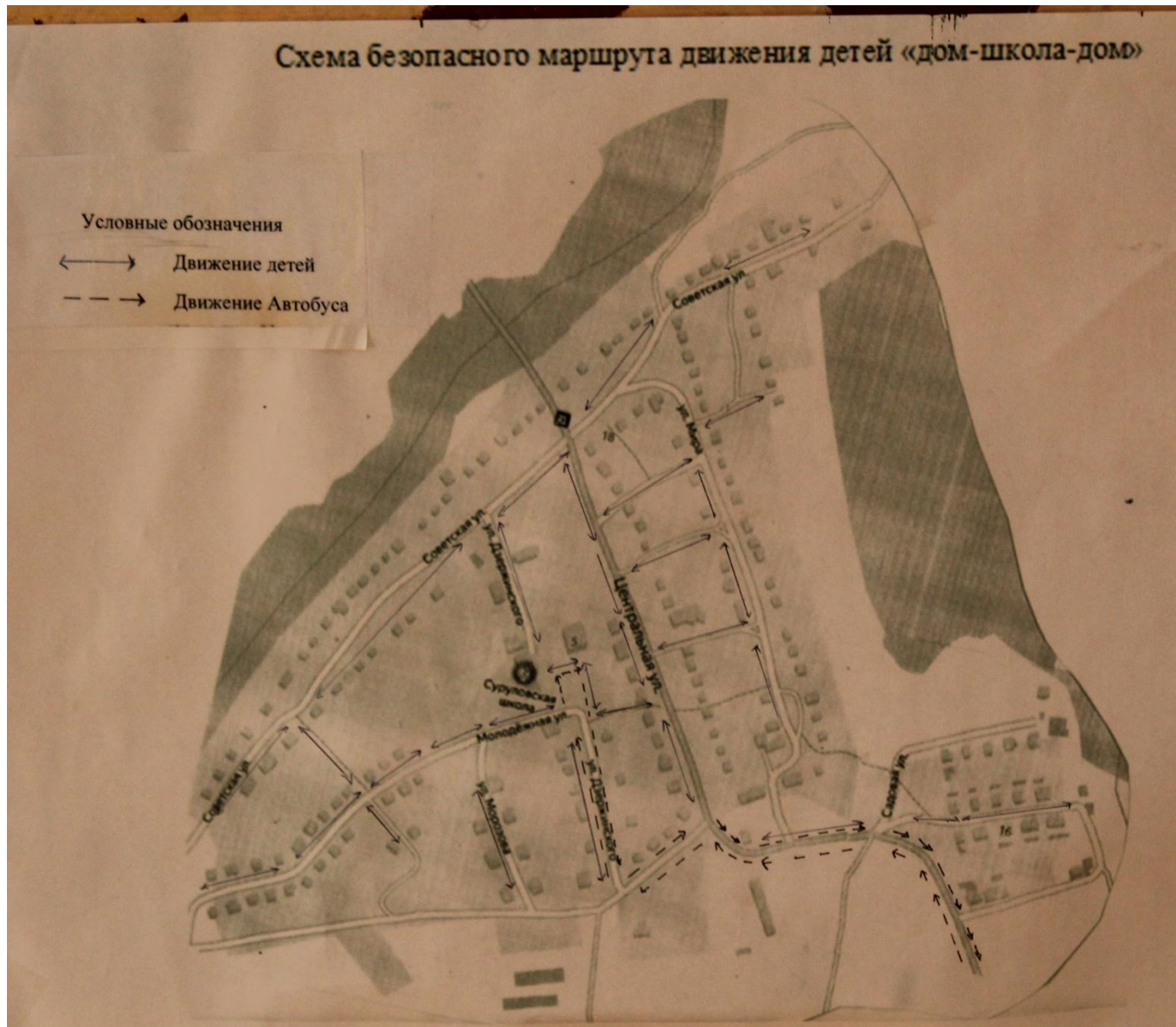
Схема безопасного маршрута движения детей «дом-школа-дом»